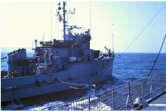
Op deze foto's is de SPA aan het olieladen vanaf de A961 ZINNIA