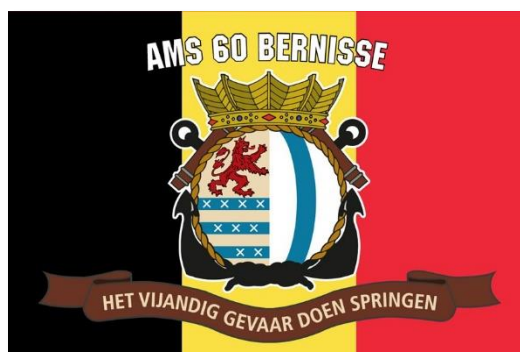
AMS Bernisse, onder twee vlaggen

Zou u ook zo graag 1 of meerdere van deze unieke stickers in uw bezit willen hebben? Dat kan. Ze zijn weerbestendig dus ideaal voor op de auto en welk ander vervoermiddel dan ook. Ze kosten € 2,50/stuk exclusief verzendkosten (postzegel). De Bernisse zal blij zijn met uw aankoop omdat de nettowinst in z'n geheel daarnaartoe gaat.