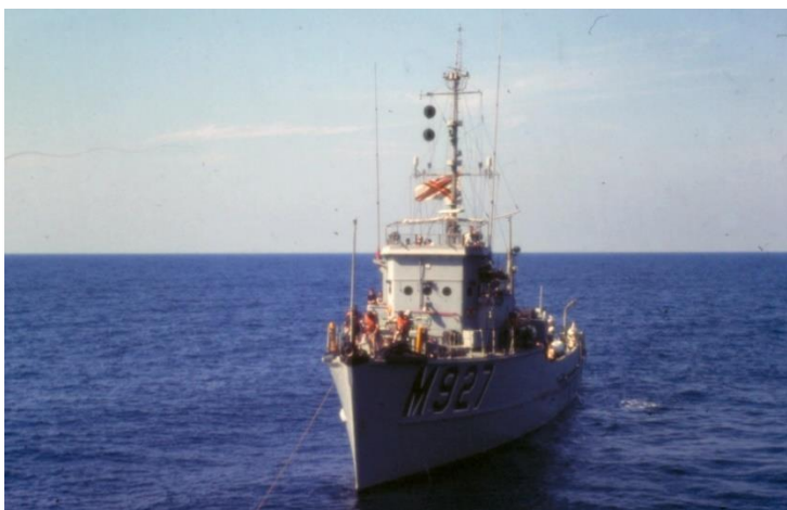
De Spa tijdens een sleepoefening met de A961 ZINNIA