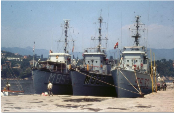
Op foto, van links naar rechts M855 Hr. Ms. Breskens (NL), M327 SPA (B) en 5532 ALLORO (I) In de haven van Santa Margherita in Italië.

In 1973 was hij matroos bij de Belgische Zeemacht en geplaatst op het logistieke steunship A961 ZINNIA tijdens een NATO-oefening op de Middellandse Zee.